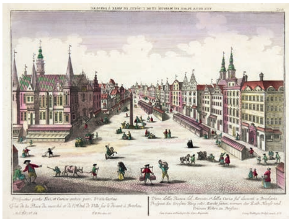
285. F. B. Werner. Widok Rynku we Wrocławiu. 1760.