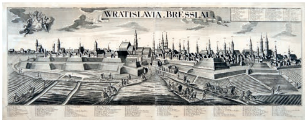
283. G.B. Probst. Panorama Wrocławia. Ok. 1750.