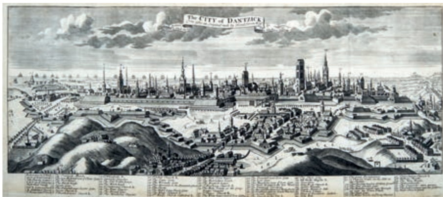
266. T. Bowles, J. Bowles. Panorama Gdańska. Po 1734.