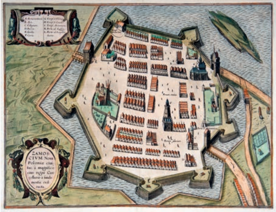
286. G. Braun, F. Hogenberg. Widok Zamościa. 1617.

ponieważ rycina służyła do oglądania w specjalnych skrzynkach optycznych, gdzie obraz ulegał odwróceniu. Piękny stary kolor. Stan bardzo dobry. (Patrz ilustracja na stronie poprzedniej)