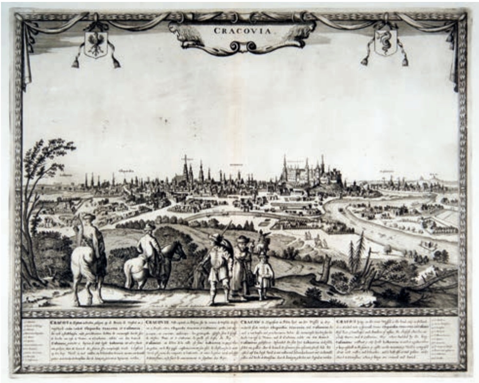
273. F. de Wit. Panorama Krakowa. Pocz. XVIII w.