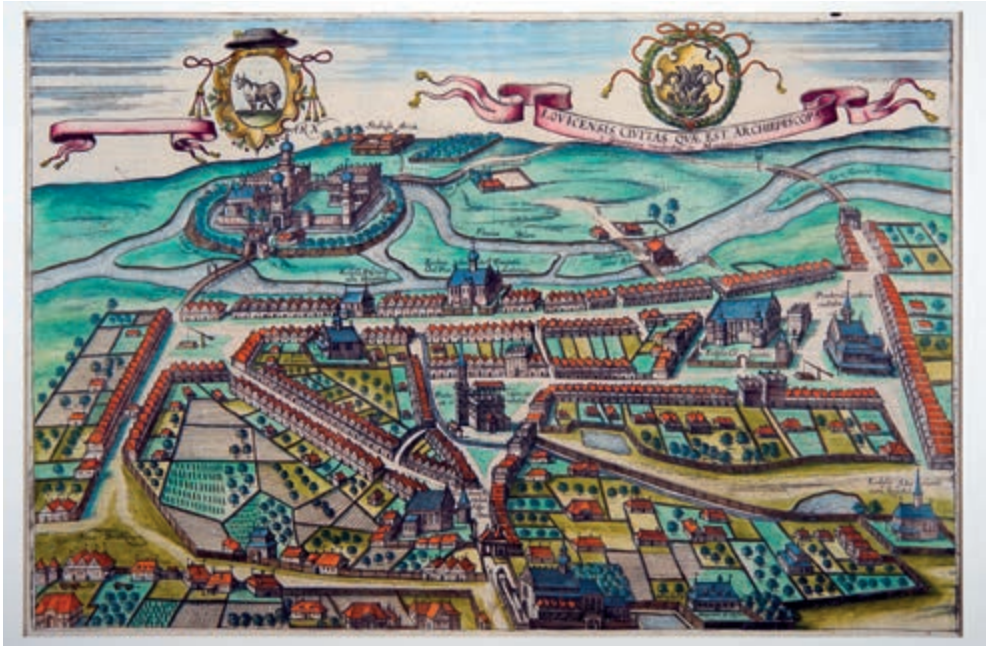
274. G. Braun, F. Hogenberg. Panorama Łowicza. 1617.