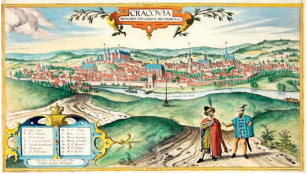
272. G. Braun, F. Hogenberg. Panorama Krakowa. 1617.