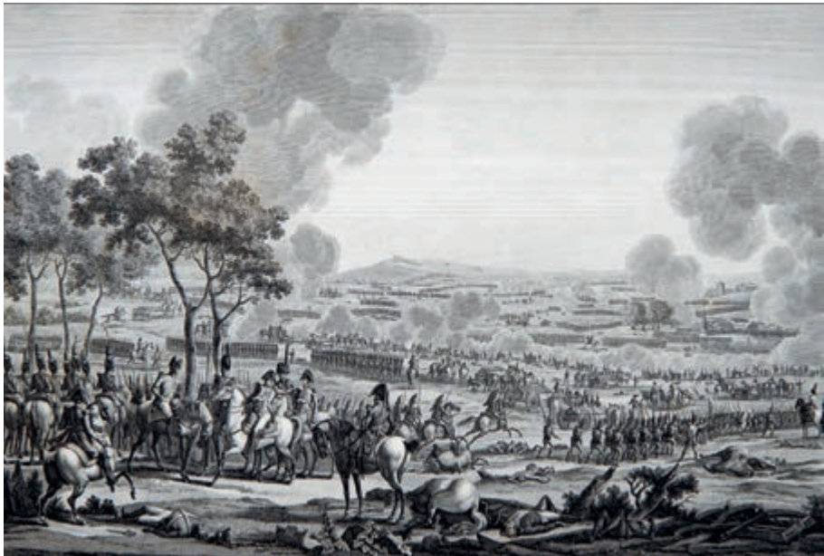
308. J. F. Swebach. Bitwa pod Wagram. XIX w.