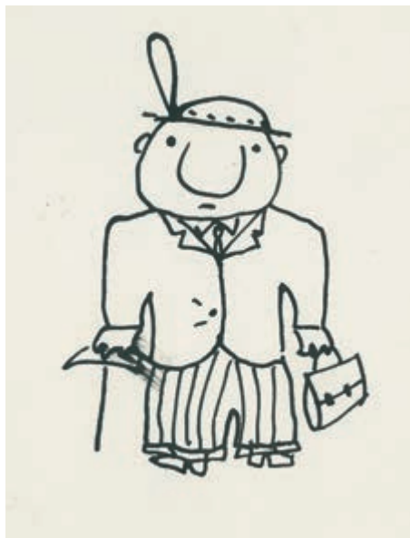
350. S. Mrozek. Zespół ilustracji. 1957-1958.