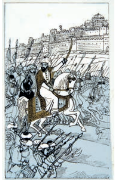
355. J. Wilkoń. Czarny anioł. Ok. 1978.