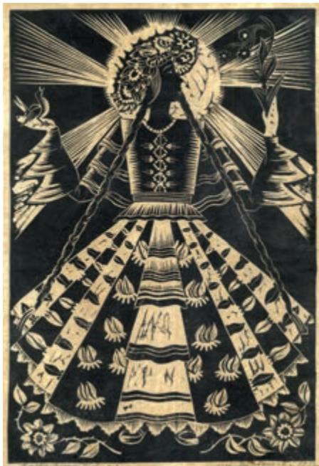
326. M. Jabłoński. Matka Boska Zielna. 1932.