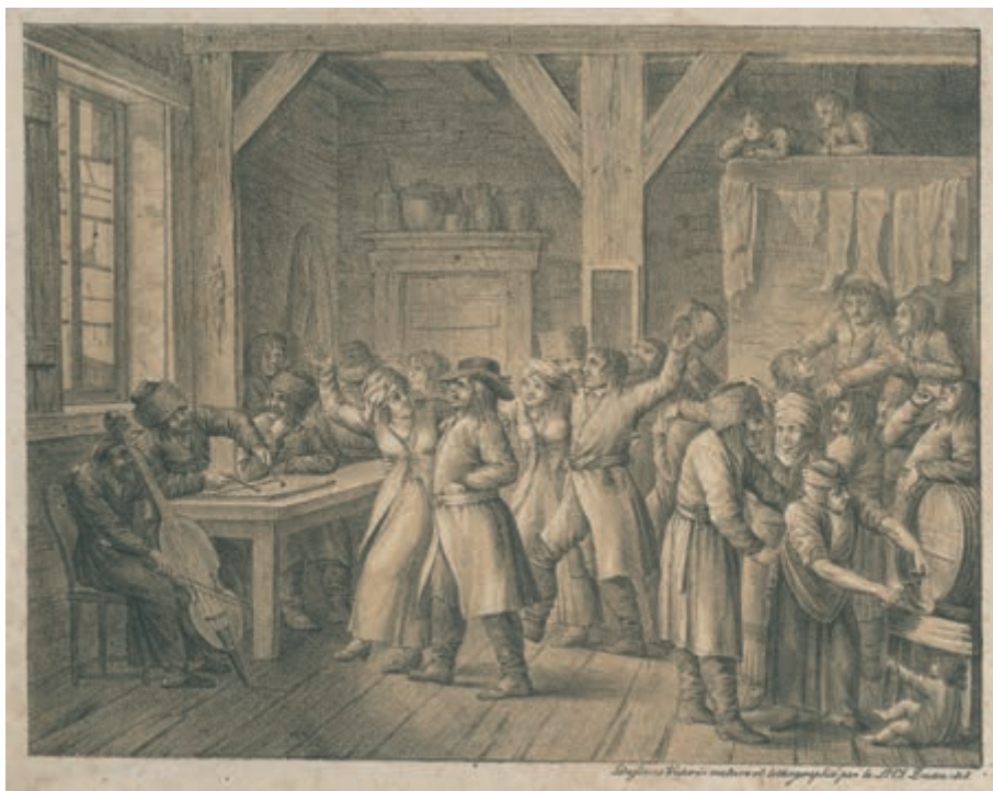
339. K. Żwan. Karczma polska. 1818 (amatorska pracownia A. Chodkiewicza).