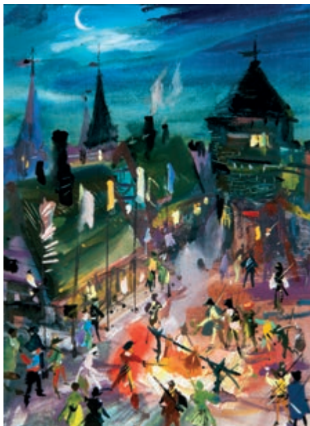
344. J. Grabiński. Biwakujący żołnierze (akwarela).