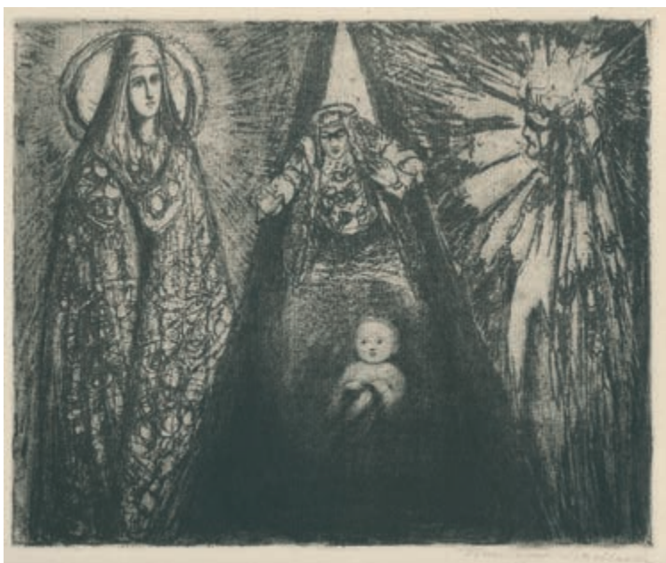
331. F. Siedlecki. Narodziny - Trzy wróżki. 1913.