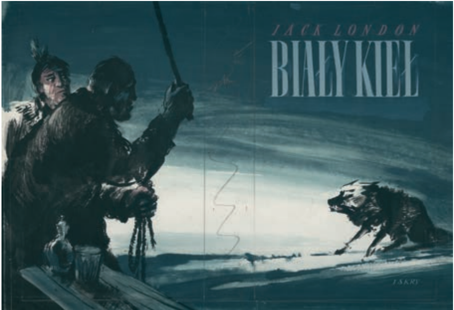
341. J. Grabiński. Projekt okładki do powieści Jacka Londona „Biały kiel”. 1953.