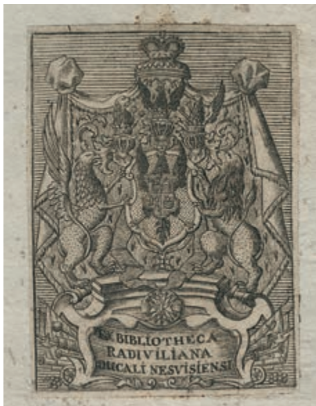
358. Ekslibris Michała Kazimierza Radziwiłła.