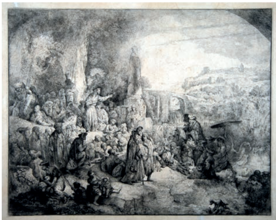
330. J.P. Norblin. Kazanie św. Jana Chrzciela. 1808.