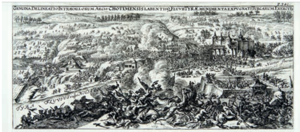
304. R. de la Hooghe. Bitwa pod Chocimiem 10 lutego 1673 r.

skandal i ingerencję cenzury – konfiskatę płyty. Mimo tego rycina zyskała ogromną popularność w całej Europie i była wielokrotnie kopiowana w XVIII i XIX w. Oferowana grafika powstała wkrótce po oryginalnej; wzdłuż dolnego marginesu angielski adres wydawniczy (z błędem) – została wydana przez Roberta Sayera (1725-1794), księgarza londyńskiego, którego nazwisko figuruje także na rycinie. Stan dobry.