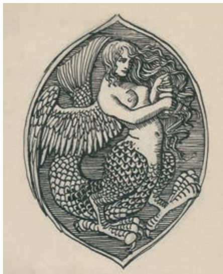
334. W. Skoczylas. Syrenka. I poł. XX w.