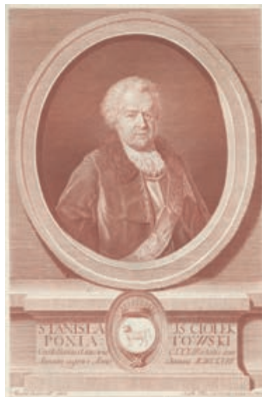
299. Stanisław Poniatowski. 1767.