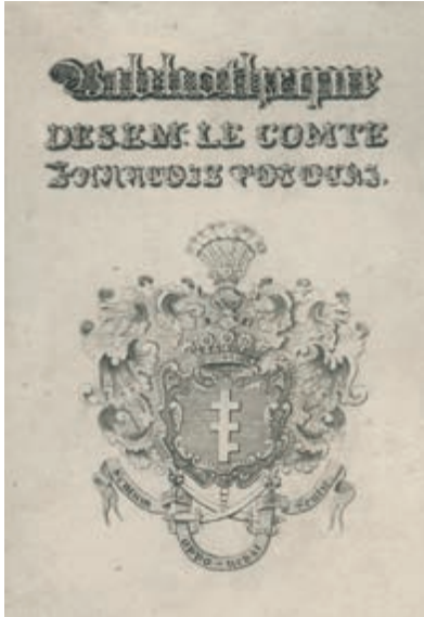
357. Ekslibris F. Potockiego. Po 1824.