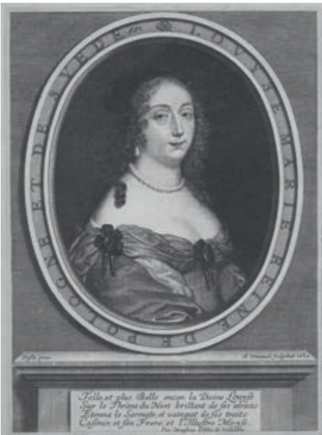
293. R. Nanteuil. Ludwika Maria. 1653.