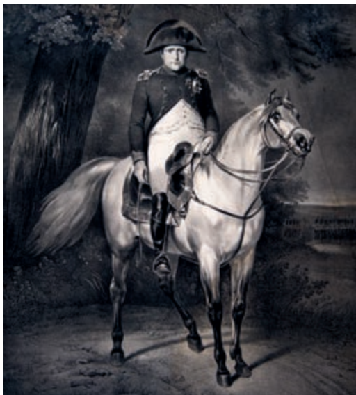
296. Napoleon Bonaparte. XIX w.