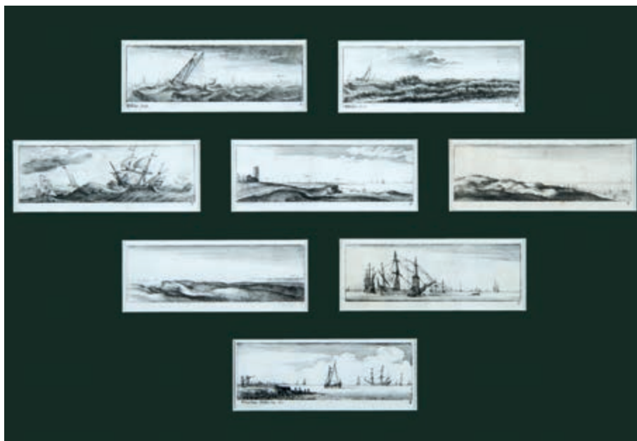
324. W. Hollar. Małe widoki morza (seria 8 akwafort). XVII w.