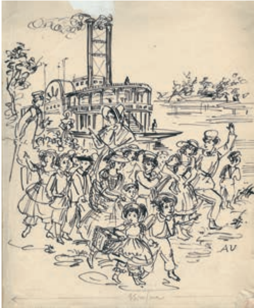
353. A. Uniechowski. Tomek Sawyer. Ok. 1951.