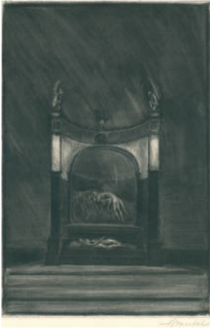
320. K. Brandel. Grobowiec. 1912.