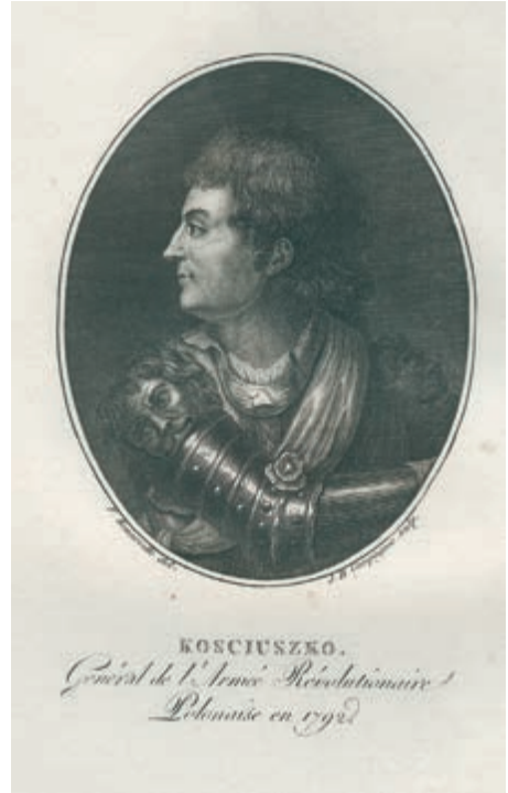
291. JT. Kościuszko. Ok. 1794.