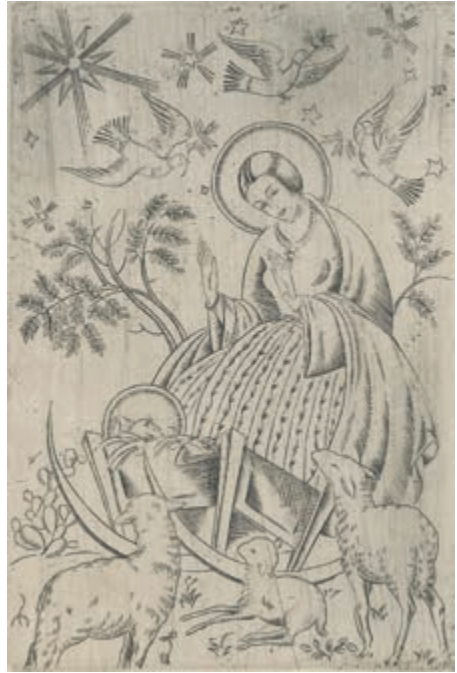
321. S. Ostoja-Chrostowski. Adoracja Dzieciątka.