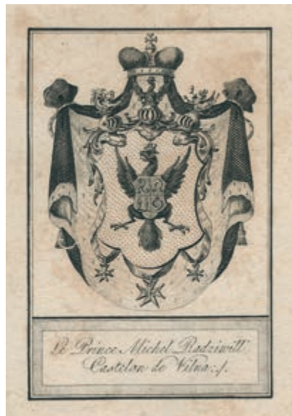
359. Ekslibris Michała Hieronima Radziwiłła.