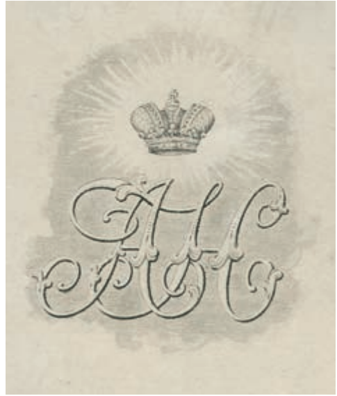
361. Zespół ekslibrisów rosyjskich. XIX-XX w.