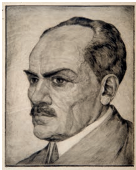
335. W. Skoczylas. Stefan Żeromski. 1918.