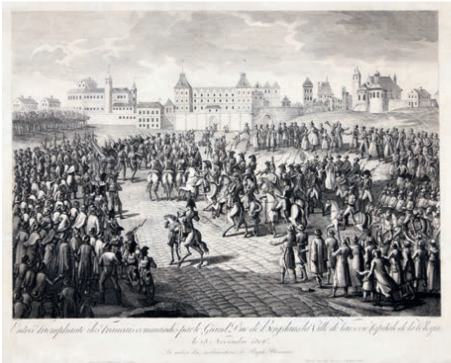
306. P. A. Le Beau. Wkroczenie wojsk francuskich do Warszawy. Po 1806.