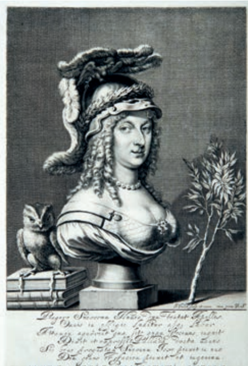
292. J. Falck. Królowa Krystyna. 1649.