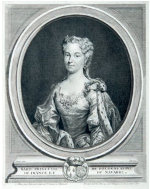
294. J. B. van Loo. Maria Leszczyńska. XVIII w.