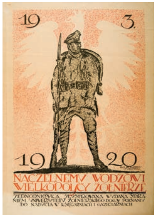
419. J. Wroniecki. Plakat. 1920.