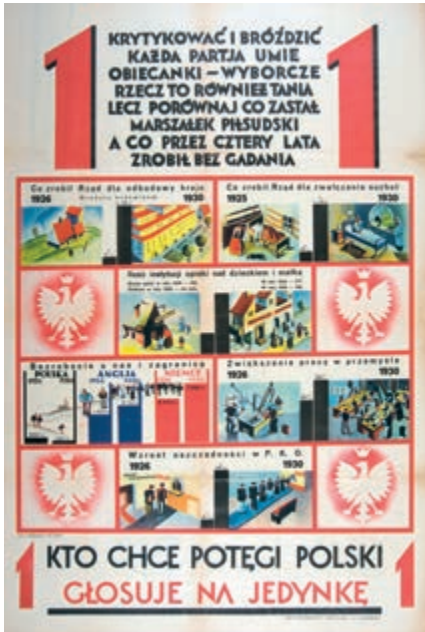
428. Plakat wyborczy. 1930.