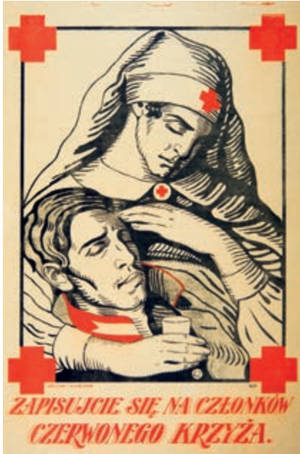
423. Czerwony Krzyż. Plakat.