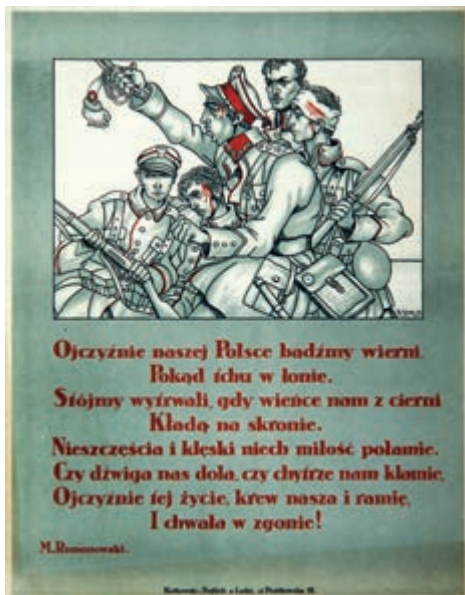
420. A. Szyk. Plakat. 1920.