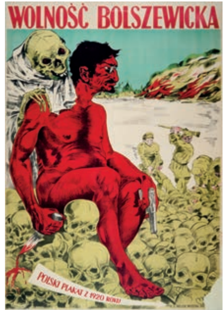
431. Niemiecki plakat propagandowy. 1943.

Lit.: A. Szablowska, M. Seńkiw, Plakat polski, Warszawa 2009, s. 338, poz. 477, ilustr. (wersja sławiąca osiągnięcia w rolnictwie) (Patrz ilustracja)