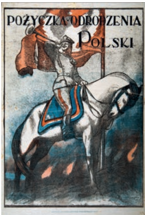
418. S. Bohusz-Sietrzeńcewicz. Plakat. 1920.