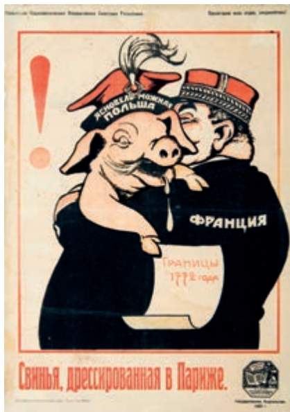
421. Sowiecki plakat propagandowy. 1920.