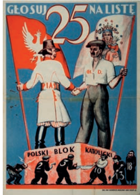
425. Plakat wyborczy. 1928.

powyżej „Proletariusze wszystkich krajów łączcie się” oraz „Rosyjska Socjalistyczna Federacja Radziecka Republika”. Ślady składania, zabrudzenia, drobne uszkodzenia krawędzi (podklejone, po konserwacji).