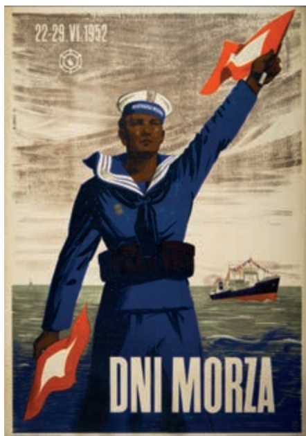
434. Dni Morza. Plakat. 1952.