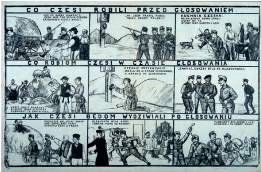
416. Spór o Śląsk Zaolziański, Spisz, Orawę. Ok. 1919.