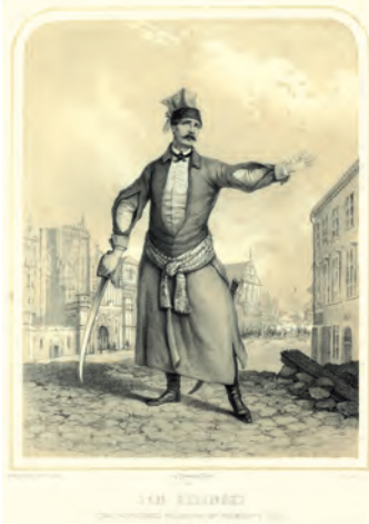
333. F. Daziaro. Jan Kiliński. 1862.