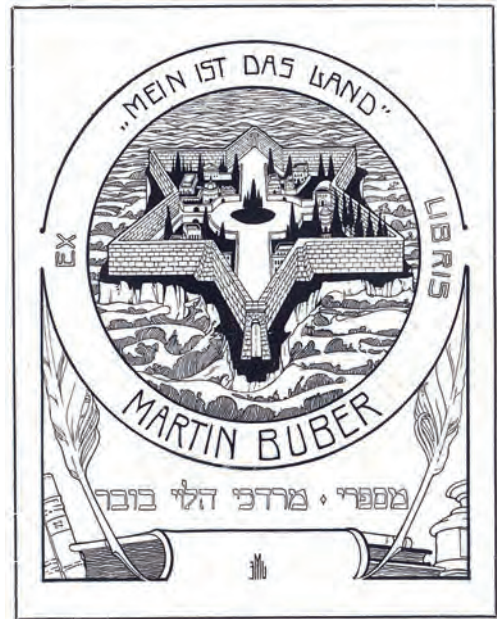
433. Zespół 48 ekslibrisów autorstwa znanych grafików europejskich. XIX/XX w.