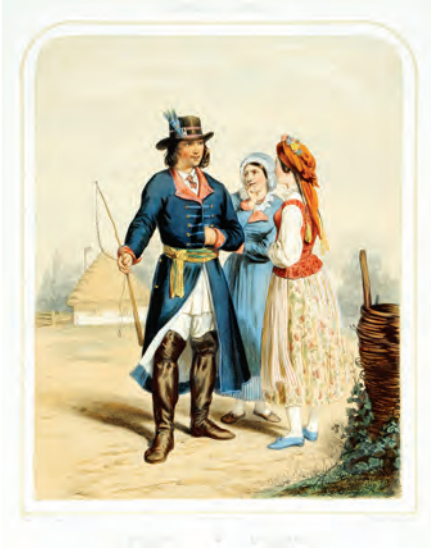
359. W. Gerson. Mazowszanie. 1855.