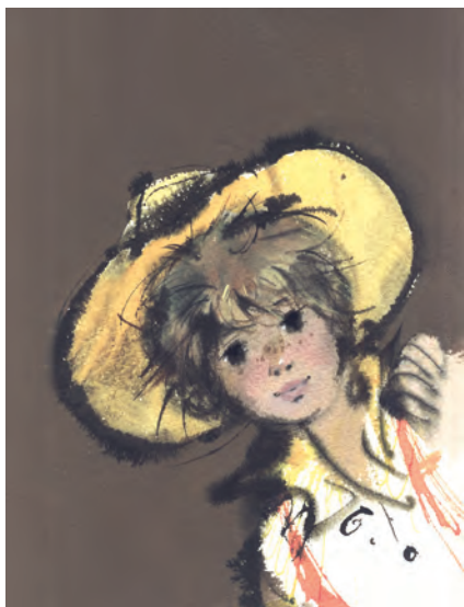
395. J. Grabiński. Tomek Sawyer. Ok. 1975.