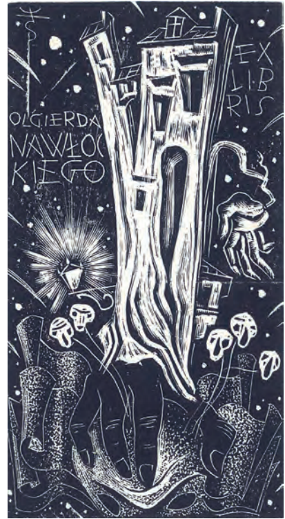
432. T. Cieślewski syn. 56 ekslibrisów.