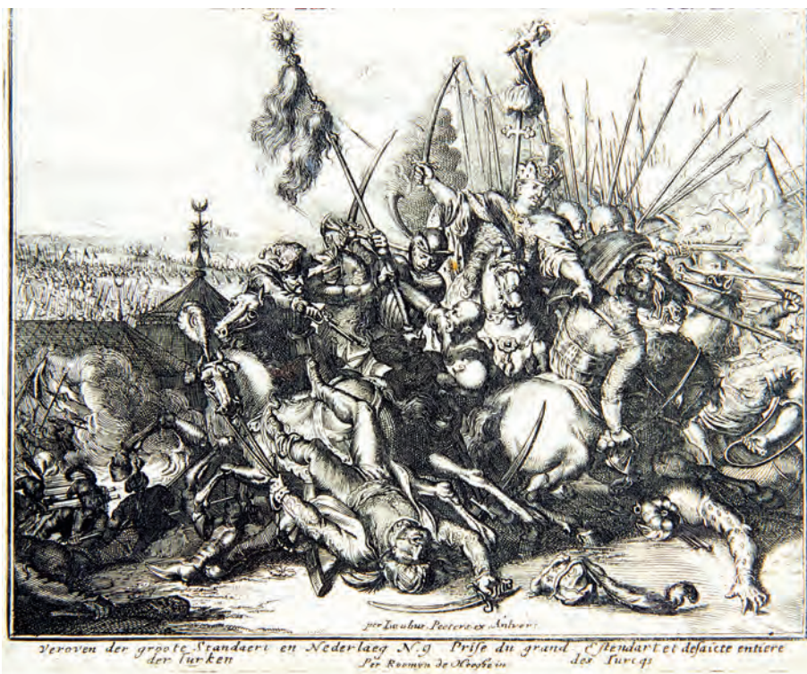
341. J. Peeters. Bitwa pod Wiedniem. Cykl 10 rycin. Po 1683.