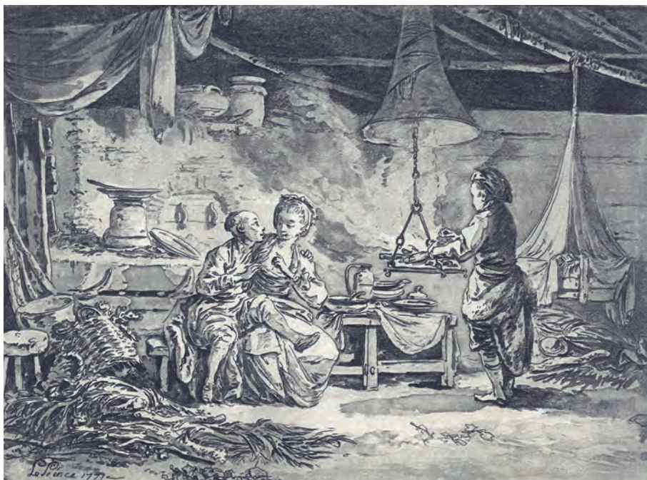
374. J.B. Le Prince. Lampa polska. 1770-1771.