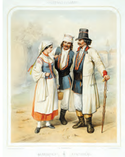
360. W. Gerson. Krakowiacy. 1855.

poz. poprzednia). Stan dobry, oprawiona w ramę 37,0 x 30,0 cm. Bardzo mocny, ładny kolor.