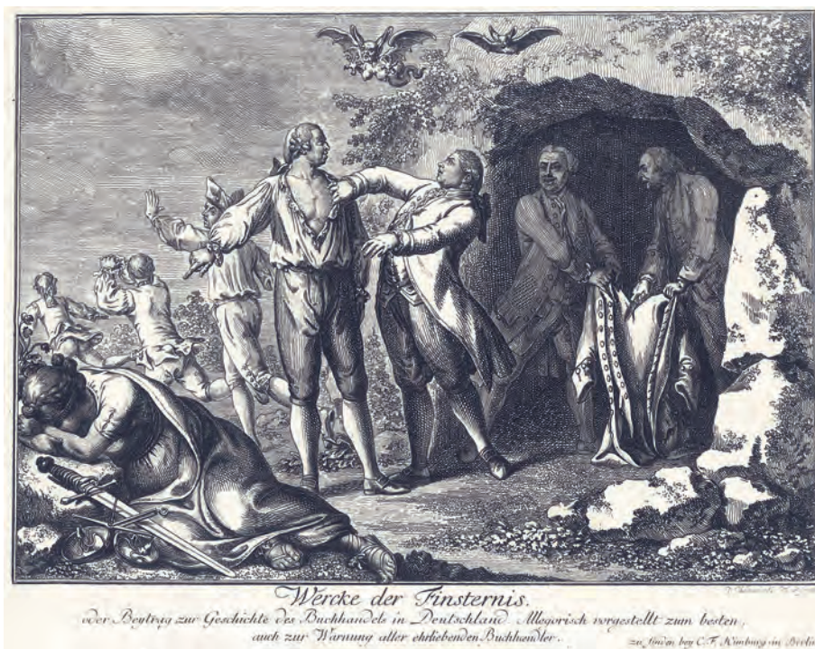
375. D. Chodowiecki. Satyra na nieuczciwych wydawców. 1781.