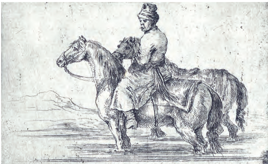
367. Stefano della Bella. Pachołek polski pojący konie. Ok. 1650-1660.