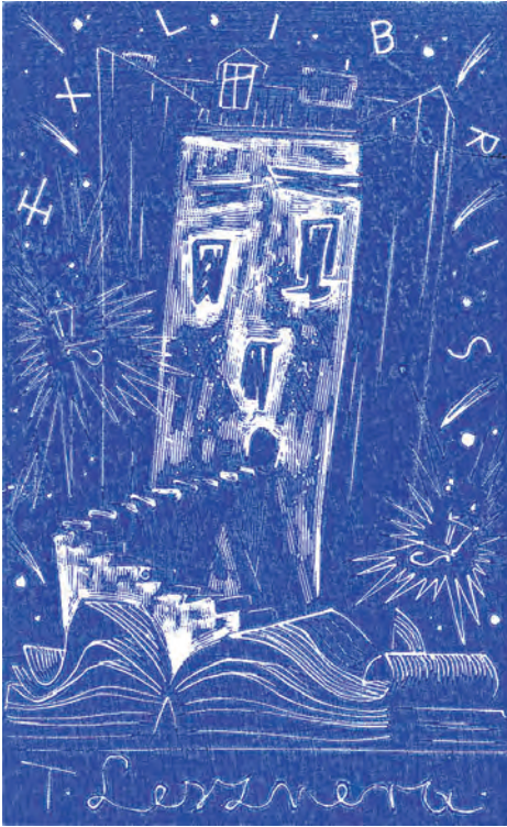
431. T. Cieślewski syn. Klocek drzeworytniczy.