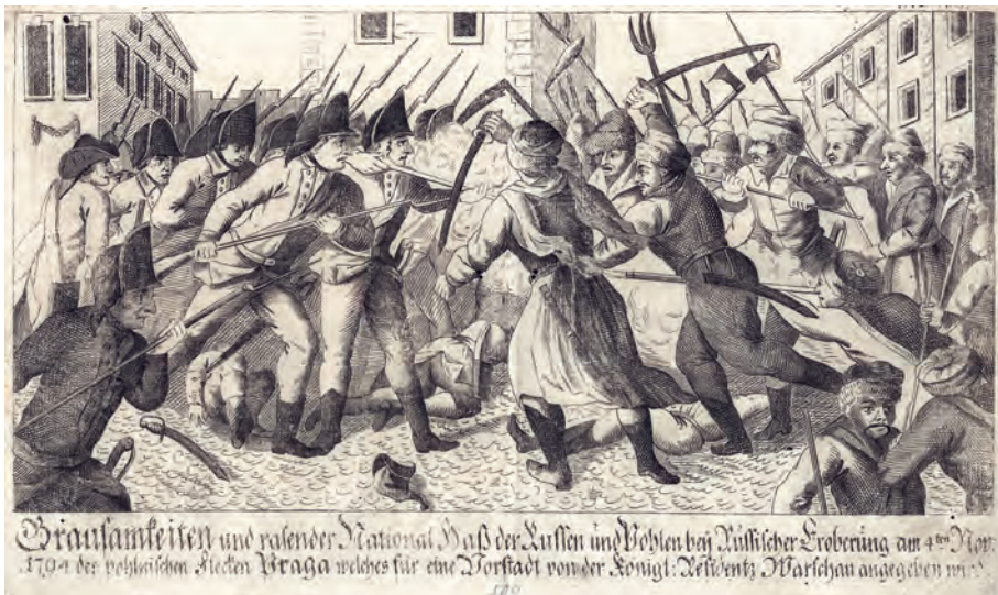
345. Rzeź Pragi 4 listopada 1794. Po 1794.