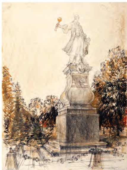
390. Pomnik Czarnieckiego w Tykocinie. 1973.

szawskiej Szkoły Rysunku. Współpracował także przy odbudowaniu zabytków Kazimierza, który stał się jednym z ulubionych tematów jego prac. Na odwrocie szkic architektoniczny. Niewielkie uszkodzenia krawędzi, poza tym stan dobry. (Patrz tablica XXX)