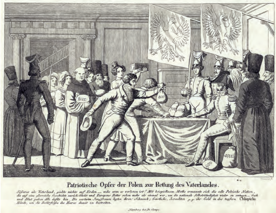
349. B. Wunder. Składanie ofiar na rzecz powstania listopadowego. Po 1831.