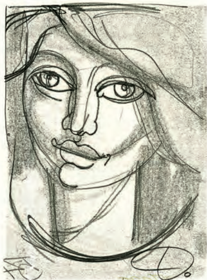
388. St. Dawski. Głowa dziewczyny. Pol. XX w.