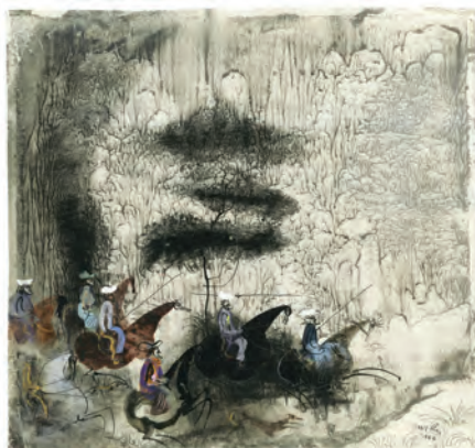
410. J. Wilkoń. Na tematy wschodnie (tusze).