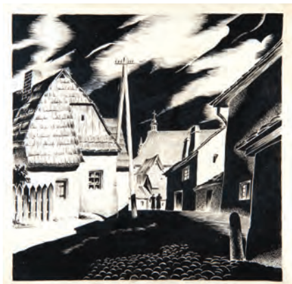
409. M. Walentyłowicz. Uliczka. XX w.