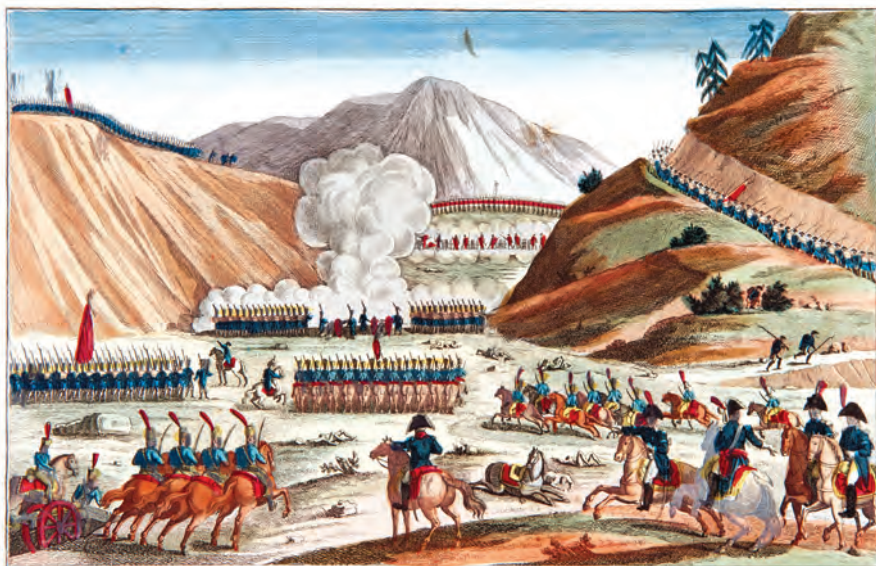
BATAILLE DE SOMO-SIERRA.