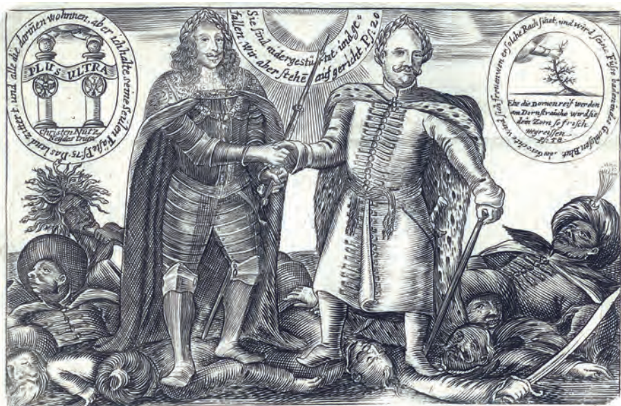
324. Portret Jana III Sobieskiego i cesarza Leopolda I. Po 1683.

i ceniony jako autor przedstawień koni, polowań i zwierząt. Portret prezentuje dobry poziom artystyczny. Drobne zabrudzenia marginesu, poza tym stan dobry.