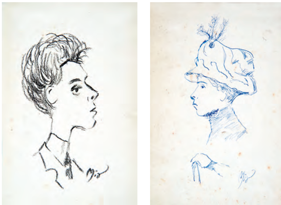
403. Kabaret „Momus”. Zespół karykatur. 1908-1912.