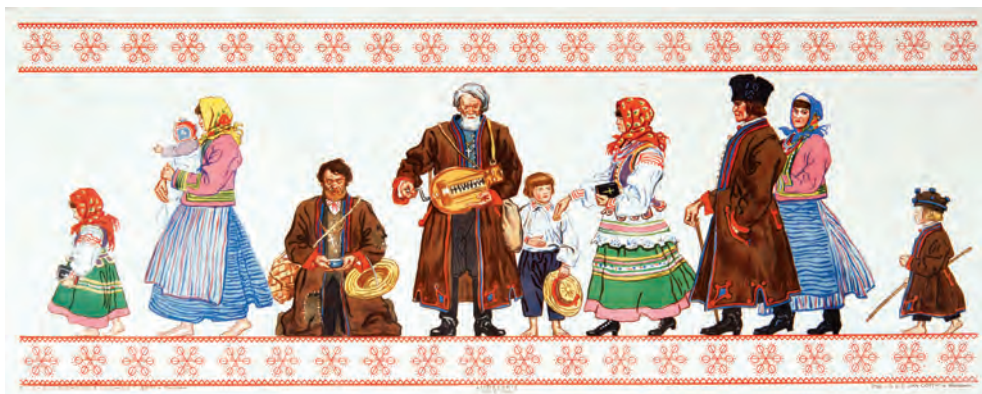
363. G. Pillati. Stroje z okolic Lublina. Pocz. XX w.