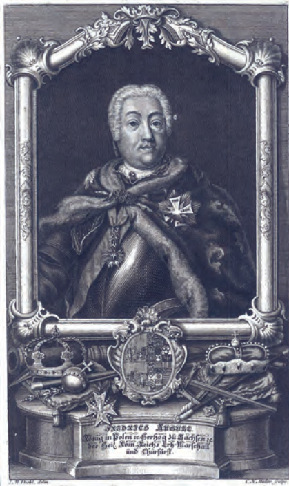
326. C.H. Müller. August III Mocny. 1743.