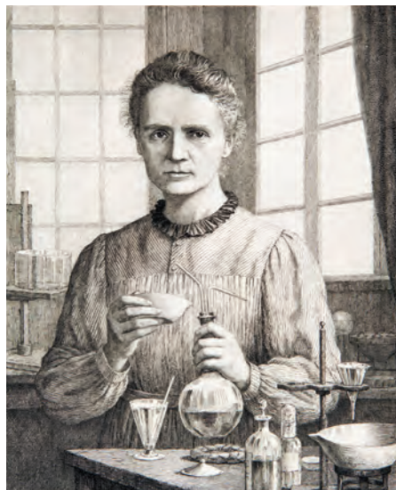
339. M. Curie-Skłodowska. Po 1905.