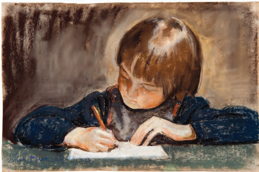
385. A. Bunsch. Piszące dziecko. 1930.

Technika własna, litografia barwna; 60,5 x 49,0 (w świetle ramy)