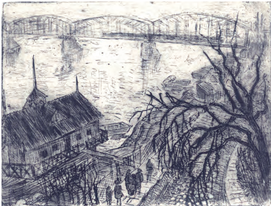
387. S. Cygler. Most. Okres międzywojenny.