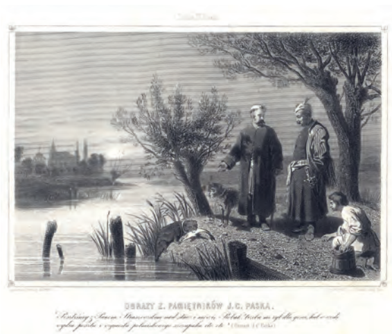
377. A. Zaleski. Z „Pamiętników” Paska. XIX w.