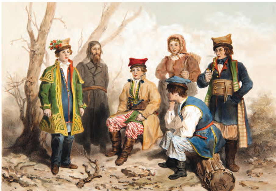
358. A. Bayot. Stroje z okolic Krakowa. Lata 40. XIX w.