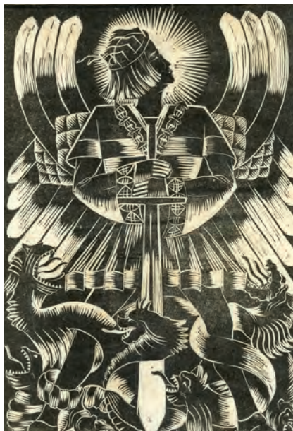
401. M. Jabłoński. Św. Michał. 1921.