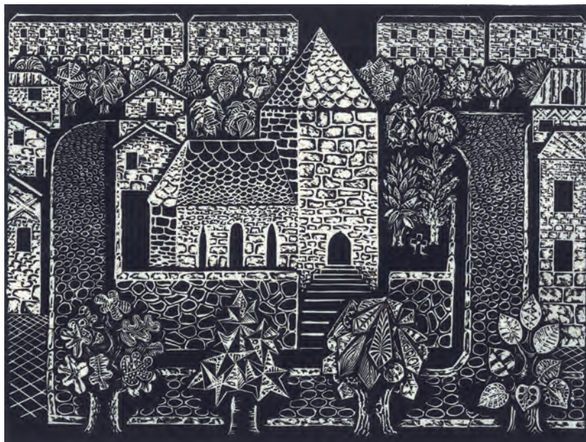
393. J. Gielniak. Kowary I. 1957.

zwierząt. Projekt ten został wykorzystany do wydania plakatu, pocztówki i wywieszki (na odwrocie naklejone karty z akceptacją do druku oraz liczne notatki redakcyjne). Bardzo dekoracyjne. Drobne uszkodzenia krawędzi, niewielkie ubytki farby. ( Patrz tablica XXX )