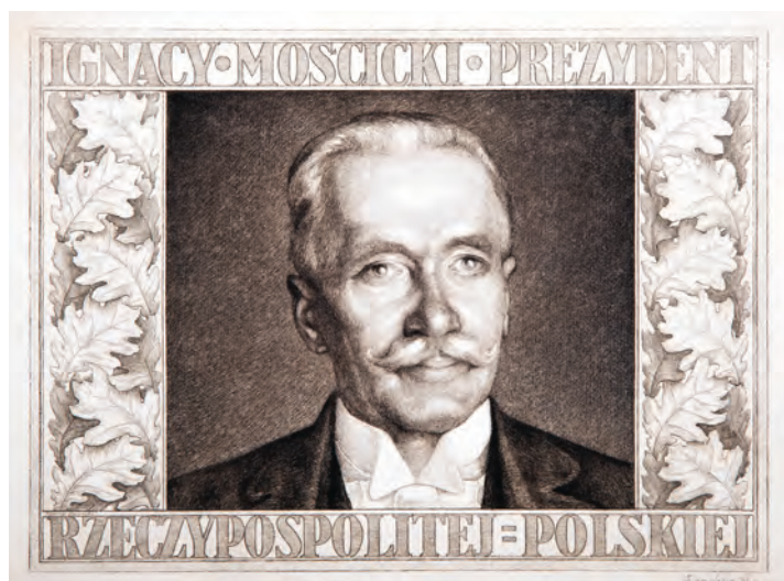
340. I. Łopieński. Ignacy Mościcki. Po 1926.

Akwaforta; 34,0 x 48,0 (pl. 44,0 x 63,0)