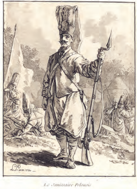
355. J.B. Le Prince. Janczar polski. 1770.

gotował podczas podróży z Rosji do Paryża, kiedy mógł także odwiedzić Polskę. Szkice sporządzone wówczas artysta wykorzystał później do tworzenia bardzo popularnych ówczesnie grafik o modnej, wschodniej tematyce. Drobne zabrudzenia marginesów, poza tym stan dobry.