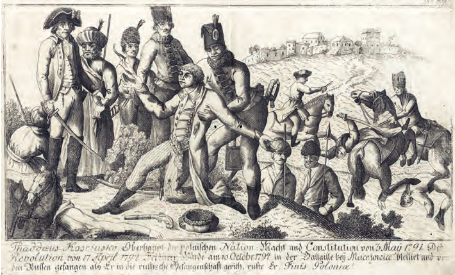
344. Bitwa pod Maciejowicami. Po 1794.