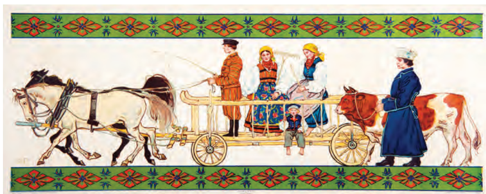
364. G. Pillati. Stroje z okolic Sieradza. Pocz. XX w.

Rodzina w strojach ludowych z okolic Sieradza, jadąca do pracy w polu. Sygnowana „G.P.” (Gustaw Pillati); odbita w Zakładzie Graficznym B. Wierzbicki i sk. (działającym w Warszawie od 1897 r. do lat 30. XX w.), wydana przez Dom Wydawniczy „Świt” A. Chlebowskiego (patrz poz. poprzednie). Uszkodzenia krawędzi, poza tym stan dobry. (Patrz ilustracja)