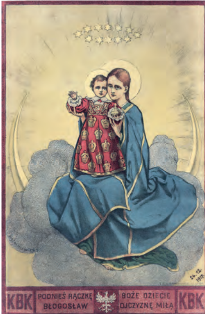
353. Pomoc ofiarom I wojny. 1917.