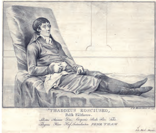
334. J.F. Martin. Tadeusz Kościuszko. 1797.

Drzeworyt barwny; 64,0 x 42,0 (cała plansza)